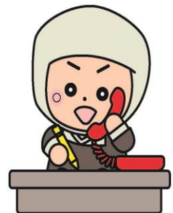
岩出市イメージキャラクター そうへいちゃん