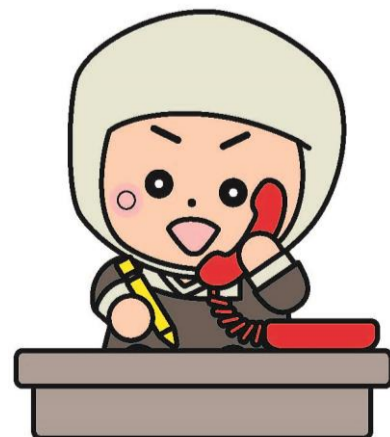
岩出市イメージキャラクター そうへいちゃん